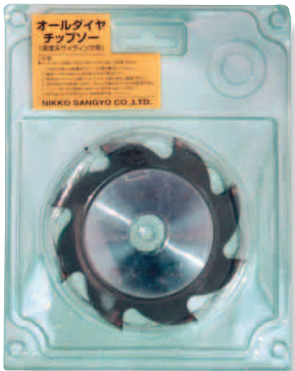
(8P x 80)~(60P x 455)迄各種