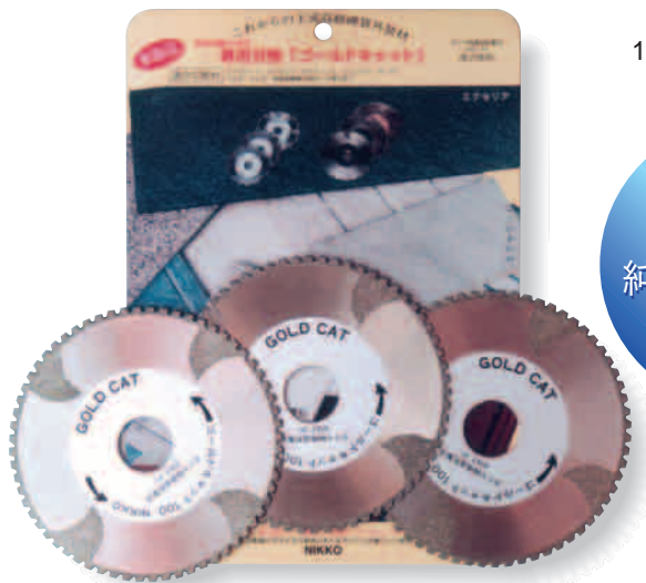
100・ 110・ 125・ 160・ 180 各種